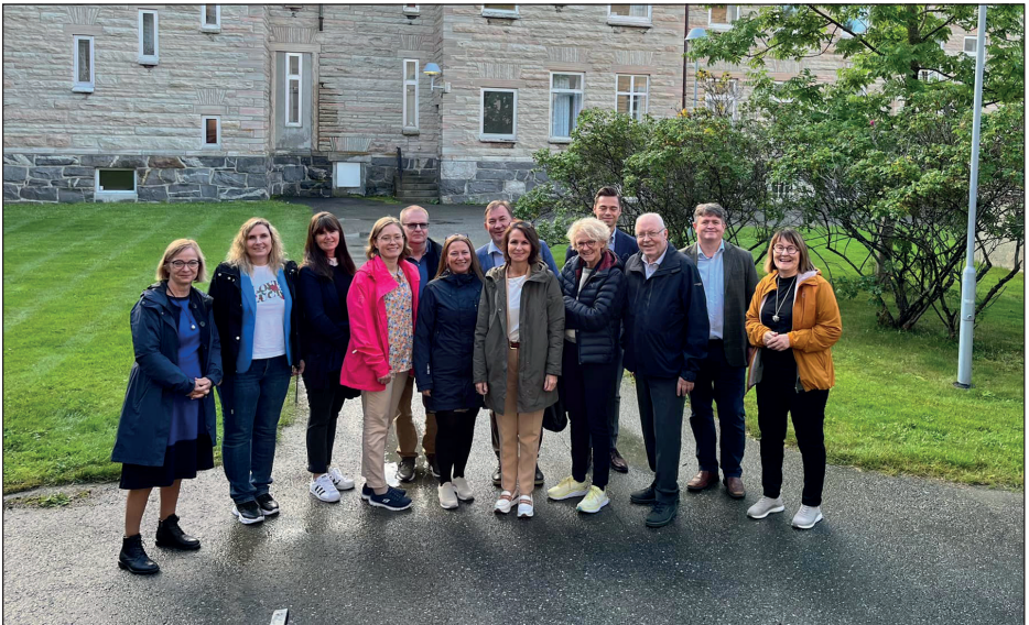
Styremøte i psykisk helse- og rusklinikken 31.08.2022. Brukerutvalgets leder har fast plass i styret som observatør med tale- og forslagsrett