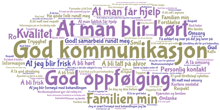
Tilbakemeldinger fra pasienter og pårørende på spørsmålet «Hva er viktig for deg»? 2022