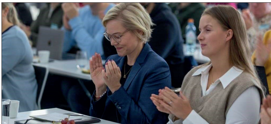
Helseinnovasjonsuka 2022.