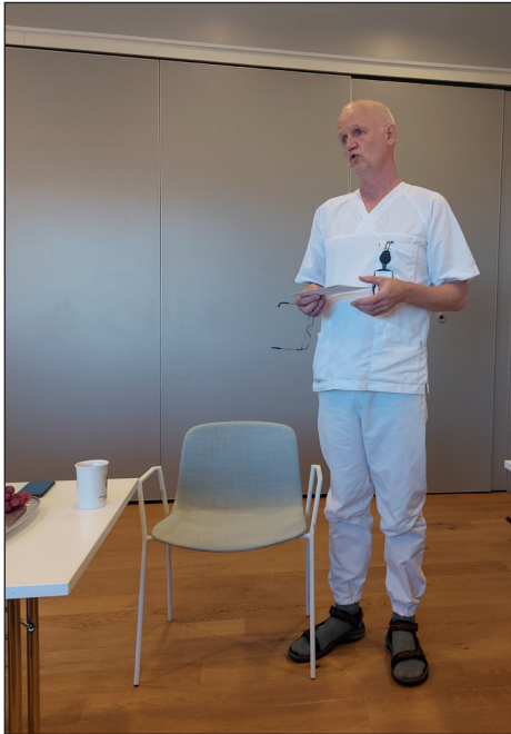
Fra omvisningen 24. august.