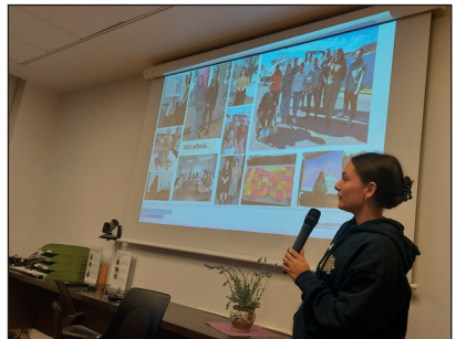
Kurs for brukermedvirkere ble gjennomført i november 2022.