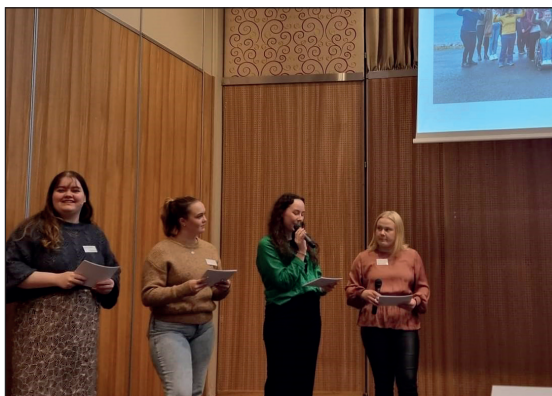
Representanter fra ungdomsrådene i Helse Nord holdt innlegg på brukerkonferansen, september 2022