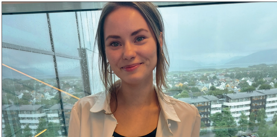
Innlegg for leger i spesialisering om samisk språk- og kulturkompetanse gjennomført 31. august.