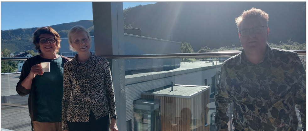
Møtet 24. august ble gjennomført på Nordlandssykehuset Vesterålen. Brukerutvalget fikk omvisning på døgnerhabiliteringsenheten og presentasjon av Nordlandssykehuset Vesterålen.

Møtedatoer er tilgjengelig i aktivitetskalenderen og referat legges ut på Nordlandssykehusets hjemmeside .