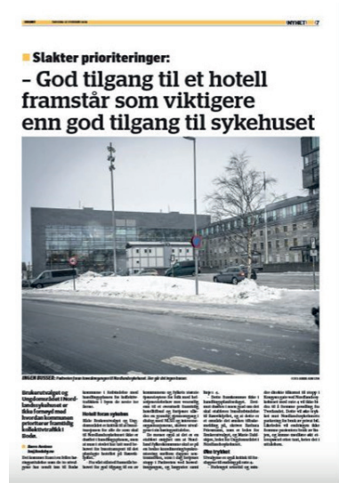
Artikkel publisert i Avisa Nordland i etterkant av innsendt hørings svar

NLSH hadde forventet en drøfting i forslaget til rullering av handlingsplanen knyttet til det behovet som er reist fra flere aktører og interesseorganisasjoner, herunder NLSH, vedrørende bussforbindelse til hovedinngangen. I dette også et konkret forslag til løsning som ivaretar det behov som fremstår åpenbart for å gi pasienter og pårørende god og nær tilgang til NLSH. Tidligere er det diskutert, og enighet om, at Nordland fylkeskommune ville se på en bedre koordinering/synkronisering mellom dagens sentrumsbuss som i dag betjener stopp i Parkveien ved hovedinngangen, og langruiter samt linje 1-4. Dette fremkommer ikke i handlingsplanforslaget. Derimot drøftes i noen grad om det skal etableres bussforbindelse til Rønvikfjellet, og at dette er et område det ønskes tilbakemelding på. Fra vårt ståsted fremstår behovet for god tilgang til en av kommunen og fylkets største tjenesteytere for personell med helsetjenestebehov mer vesentlig enn til et evt. framtidig hotelltilbud og fortjener således en grundig gjennomgang i dialog med NLSH og interesseorganisasjonene.