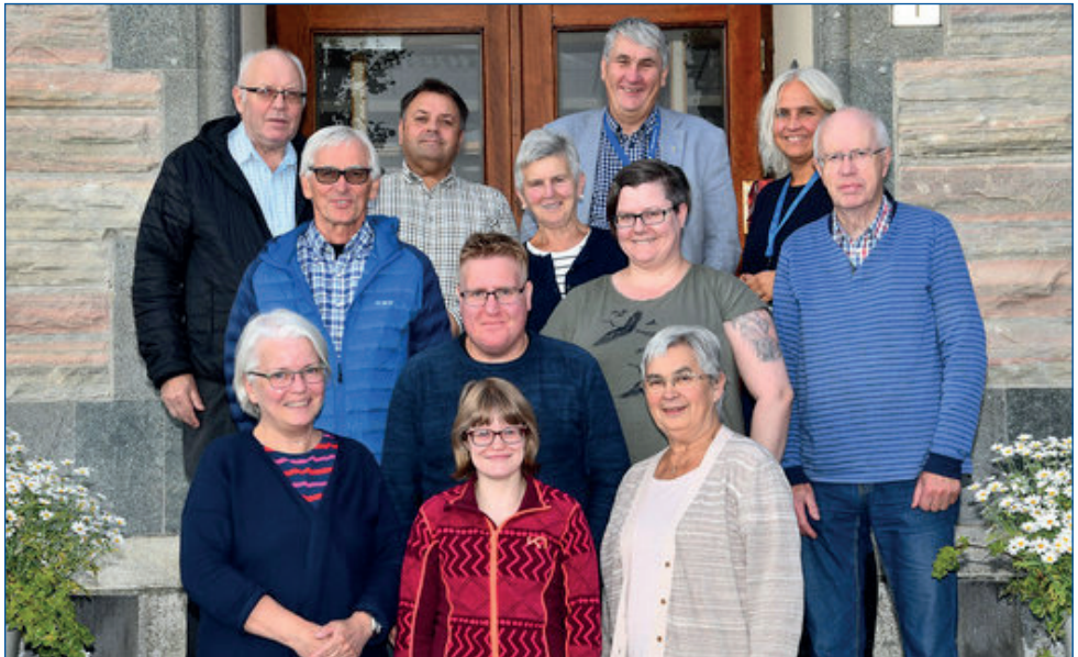
Brukerutvalget på omvisning på Rønvik.

Møtedatoer er tilgjengelig i aktivitetskalenderen og referat/protokoll legges ut på Nordlandssykehusets hjemmeside www.nordlandssykehuset.no