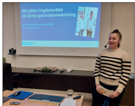
Bilder fra kurs for brukermedvirkere, gjennomført 9. november.