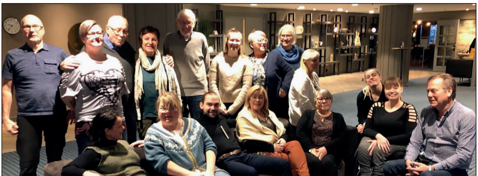
Regionalt brukerutvalg og representanter for ungdomsrådene og brukerutvalgene i foretakene var samlet i Bodø 11. november.